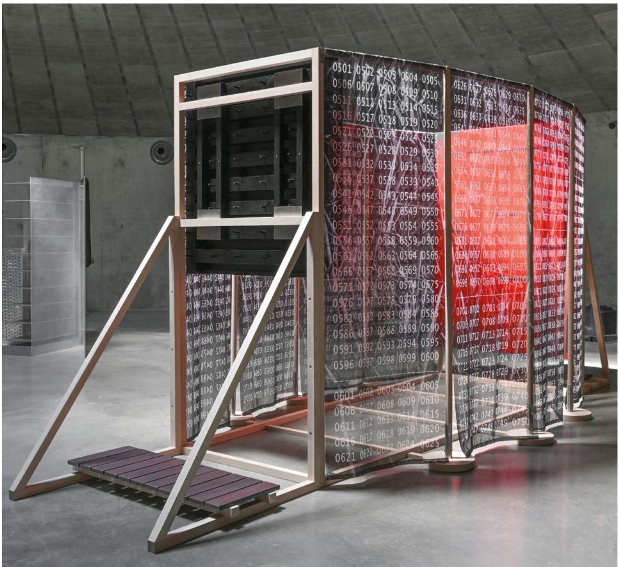
ADDITIVE LINEARE FREQUENZ (ADD. LIN. FRE.) 17: NEIN-NON-NE, 1991/2022-24

Holz-/Stahlkonstruktion (Esche, Nirosta); Hängeobjekt: Acryllack auf Holz, Papierleimung über Aludraht, Wachsstift, Acrylglasabdeckung, 121 x 112 cm; NEIN-NON-NE: Öl auf Digitaldruck/auf Leinwand, 200 x 140 cm